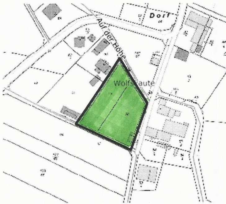
Fläche für die Landwirtschaft, ohne Maßstab